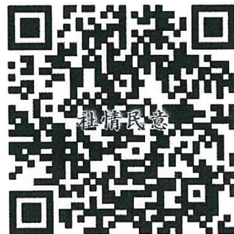
山西省委社情民意通道

新闻热线：0351-5236045 传真：0351-5236040 编辑部：0351-5236042 技术支持：0351-5236044 黄河新闻网举报电话：0351-5236046 黄河新闻网举报邮箱：sxhhtd@126.com 本网站由黄河新闻网版权所有 晋ICP备2021002877号 增值电信业务经营许可证：晋B2-20060016 189 广播电视节目制作经营许可证：(晋)字第00232号 人员查询 互联网新闻信息服务许可证：14120180001 信息网络传播视听节目许可证：0407189 晋公网安备 14010602060069号 广告经营许可注册：1401001304387