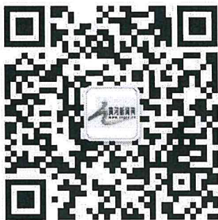
黄河新闻网官方微信