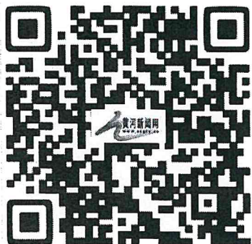
黄河新闻网手机版